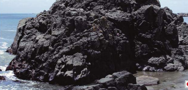
● 犬岩 Inuiwa Dog Rock

約2億年前の千葉最古の地層。源義経の愛犬「若丸」が奥州へ逃れた主人を慕い7日7晩鳴き続けて岩になったという伝説が残っています。It's the oldest stratum in Chiba prefecture about 200 million years ago. Here is a sad legend of a dog who continued roaring for 7 nights and 7 nights after his husband and became a rock. 約兩億年前形成。為千葉縣最古の地層。此地亦有這樣的傳説: 源義経*の愛犬「若丸」為了他那逃往奥州、傾慕不已的主人連續鳴叫了七天七夜, 最終化為石頭。(*源義経(1159-1189)為出生於平安時代末期的武士)