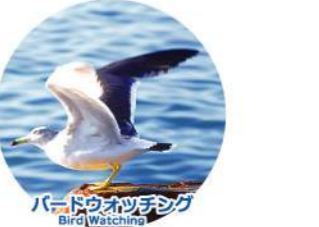
● バードウォッチング Bird Watching

日本で見られるほとんどの種類のカモメが観察できます。You can observe most kinds of seagulls inhabiting in Japan. 在此可以觀察到在日本可見的幾乎全部種類海鷗。