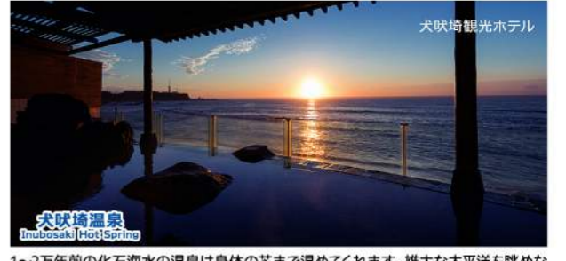
● 犬吠埼温泉 Inubosaki Hot Spring

特大サイズの磯牡蠣は夏の銚子を代表する味覚です。An oversized oyster is one of tastes that represent Choshi in the summer. 特大尺寸の牡蠣為代表銚子之夏季美味。