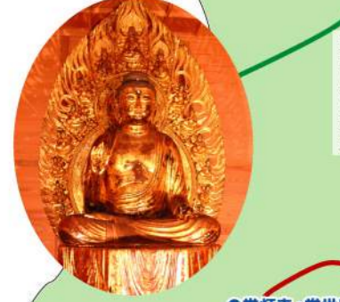
● 常灯寺・常世田薬師 Jotoji Temple, Tokoyodayakushi tree stat

醤油 Soy Sauce 銚子の特上醤油は利根川を経て江戸の食文化を開花させました。This soy sauce was carried to Old Tokyo via Tone River and developed the food culture. 銚子の特上醤油經由利根川使江戸*之食文化華麗綻放。(*江戸為東京之舊稱)