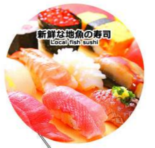
● 新鮮な地魚の寿司 Local fish sushi

銚子漁港(第一卸売市場) Choshi Fishing Port (Wholesale Market No.1) 第一卸売市場では大型のマグロ類の入札風景を見学できます。You can view the exciting scene of tuna and marlin lined up from the 2nd floor. 於第一卸売市可以參觀大型鮪魚類的拍賣下標過程。