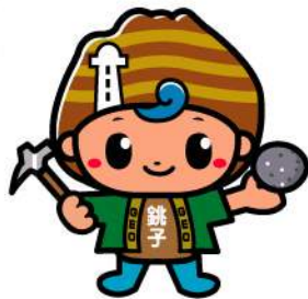
銚子ジオパークPRキャラクター『ジオっちょ』