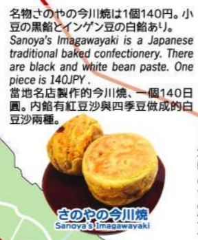
● さのやの今川焼 Sanoya's Imagawayaki

銚子ジオパークのみどころ Choshi Geopark's site to see 銚子地質公園の観光亮點 ● 日本遺産の構成文化財 Japan Heritage's cultural property 日本遺産の構成當地歴史之文化財