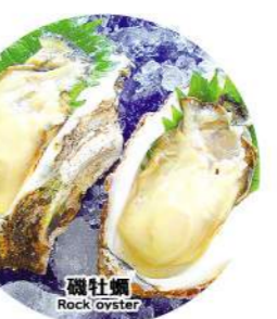
● 磯牡蠣 Rock oyster

犬吠埼 Cape Inubosaki 犬吠埼では約1億2,000万年前の白亜紀の地層(国指定天然記念物)を見ることができます。Cape Inubosaki was deposited in the ocean 120 million years ago. It's designated as a natural monument of Japan. 犬吠埼で見える犬吠埼は約一億二千萬年前之白亜紀所形成的古老地層(現為國家指定之自然紀念物)。