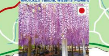
● 妙福寺(臥龍の藤) Myofukuji Temple, Wisteria Flowers