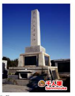
● 千人塚・岩石公園 Senninzuka, Bronzite andesite Conservation Park