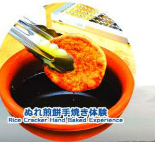
● ぬれ煎餅手焼き体験 Rice Cracker Hand Baked Experience

犬吠埼灯台 Inubosaki Lighthouse 英国人技師ブラントン(1841-1901)の設計で建造された西洋式第一等灯台。敷地内には資料館と旧番館舎があります。This lighthouse is a Western style first-class lighthouse that was built in 1874 according to the design of a British engineer. There is a museum of lighthouse and a fog tower in the premises. 以英國人技師布倫頓(1841-1901)之設計所建造的西式第一等燈塔。於燈塔建地內亦有資料館與舊番館舎。