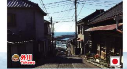
● 外川 Tokawa

銚子つりきんめ Choshi Kaname Taima 千葉県ブランド水産物。高級魚として高値で取引引きされています。Brand fishery products in Chiba prefecture. This luxury fish are traded at a high price. 千葉県著名の海産。作為高級魚, 於市場上具有非常高的價值。