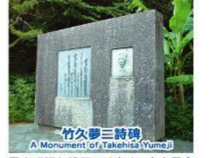
● 竹久夢三詩碑 A Monument of Takehisa Yumeji

日本で見られるほとんどの種類のカモメが観察できます。You can observe most kinds of seagulls inhabiting in Japan. 在此可以觀察到在日本可見的幾乎全部種類海鷗。