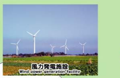
● 風力発電施設 Wind power generation facility

夫婦ヶ鼻 Medogahana 銚子ポートタワー下の崖は約1700万年前に日本海ができた頃に堆積した泥岩でできています。The cliff under the Choshi Port Tower is made of mudstone deposited 17 million years ago when the Sea of Japan was formed.